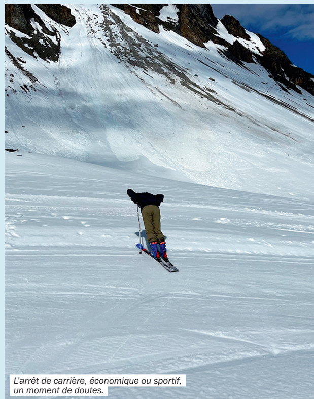
L'arrêt de carrière, économique ou sportif, un moment de doutes.

« Vous terminez dans les 15 premiers aux championnats du monde, et votre carrière s'arrête faute de moyens personnels financiers suffisants. Vous ne pouvez pas, ne voulez pas ou ne savez pas réunir les fonds pour la saison à venir... »