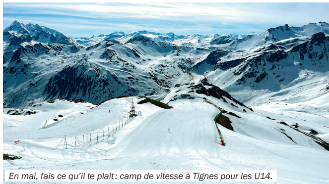
En mai, fais ce qu'il te plaît: camp de vitesse à Tignes pour les U14.

Nous savons tous que nous devons innover voire nous réinventer pour optimiser notre budget et l'obligatoire temps skié. Les projets qui couplent le ski en hémisphère Sud en été, puis en Scandinavie durant l'automne, une pratique chez nous au printemps et qui s'appuient sur l'hiver sont d'actualité pour les athlètes internationaux. Pour le commun des compétiteurs et de leurs staffs, un nouveau rythme s'impose: skier quand les pistes sont disponibles. Cela implique un changement de mentalités. Il devient alors délicat de s'adapter aux rythmes scolaires, de prévoir ses rendez-vous médicaux ou... galants, voire de profiter à vélo des week-ends de mai ou des vacances en famille. Nous avons coutume d'avancer que le sport de haut niveau implique un investissement quotidien pendant toute une carrière, il demandera également une disponibilité accrue aux entraîneurs et aux skieurs dans les années à venir.